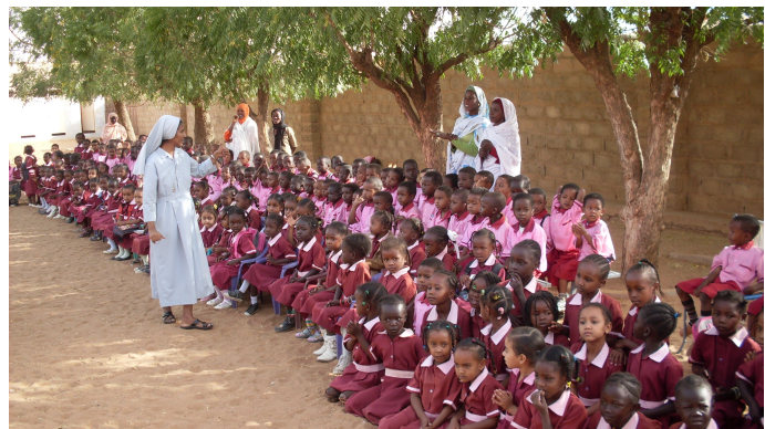
I bambini dell'asilo della Comboni School

In questa scuola ci sono circa 1200 bambini ai quali ogni giorno, oltre all'istruzione, viene dato un pasto nutriente che per alcuni di loro è l'unico della giornata. Non tutti i bambini possono però andare a scuola -anche perché i locali non sono sufficienti per ospitare tutti- perciò ci dobbiamo impegnare tutti affinché questo sia possibile!