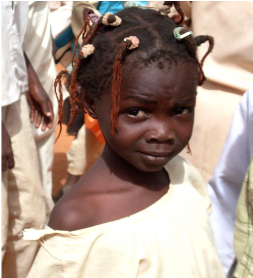
Una bambina di El Obeid

Lo sapevi che il Sudan è il paese più grande di tutta l'Africa? E' grande più di 8 volte l'Italia!